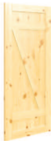
MODÈLE PETIT Z*