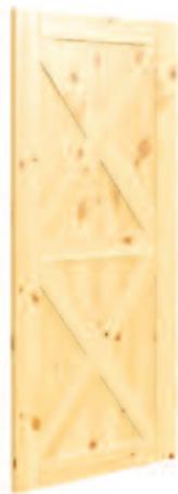
MODÈLE DOUBLE X*