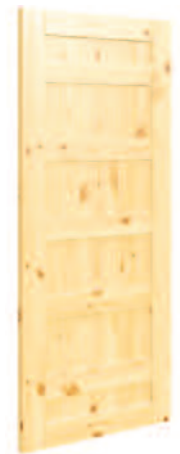
MODÈLE PANNEAUX MULTIPLES*

* Pour créer le même design de chaque côté, vous devez acheter des planches supplémentaires.