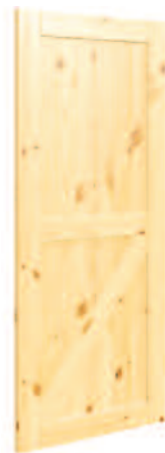
MODÈLE DEMI Z