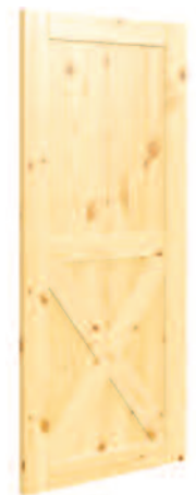
MODÈLE DEMI X*