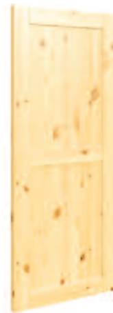
MODÈLE PANNEAU SIMPLE