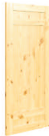
MODÈLE PANNEAU DOUBLE