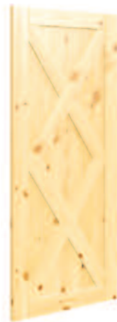
MODÈLE DOUBLE K*